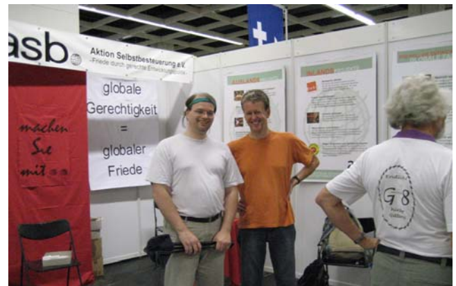
Blick in unseren Stand