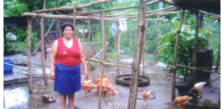
Hühnerzucht in Hausgärten

Dürrekatastrophen nicht von einer einzigen Feldfrucht abhängig zu sein, förderte PROCARES dort mit Hilfe der asb den Anbau von Obst, Gemüse und Hülsenfrüchten.