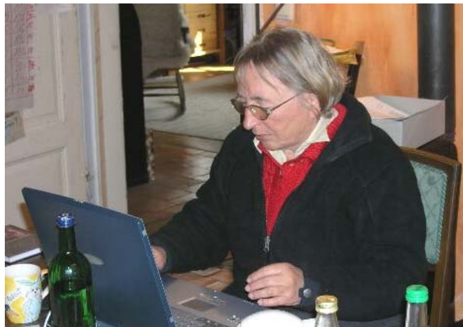
Protokoll: Astrid Standhartinger