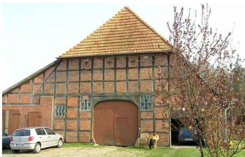
So idyllisch wohnt Beate mit ihrer WG in Kovahl

Wie gewohnt erfolgte die Projektberatung am Samstag, die Beschlüsse wurden am Sonntag gefasst. Außer den Beschlüssen selbst sind teilweise auch Zusatzinformationen durch die ProjektbearbeiterInnen oder Stichworte aus der Diskussion festgehalten.