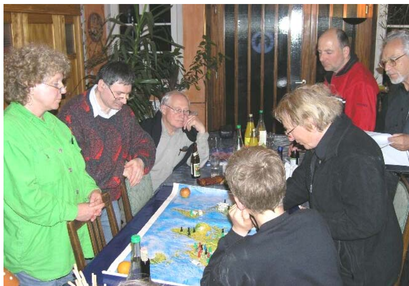
Weltverteilungsspiel: Wie viele Menschen leben in welchen Erdteilen? Wie viel verbrauchen sie? Wie viel besitzen sie?

Die asb-Webseite wurde neu gestaltet und gestrafft, die Eingabe von Metatags für die Suchmaschinen intensiviert. Dadurch ist die Zahl von Leuten, die bei der Suche nach bestimmten Stichworten rein zufällig auf die asb stoßen, offenkundig gestiegen.