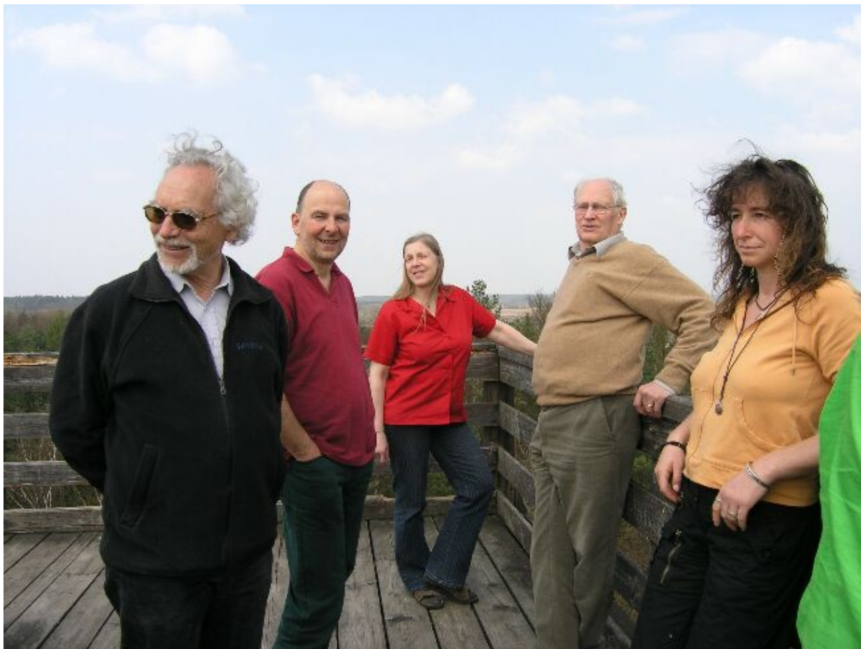
Blick vom Aussichtsturm in Kovahl „in die weite Welt“

GLS Bank Frankfurt/M BLZ: 430 609 67 Nr. 8004965500 Postbank Stuttgart BLZ: 600 100 70 Nr. 339 79 - 700 Spark. Schaumburg BLZ: 255 514 80 Nr. 320 222 292