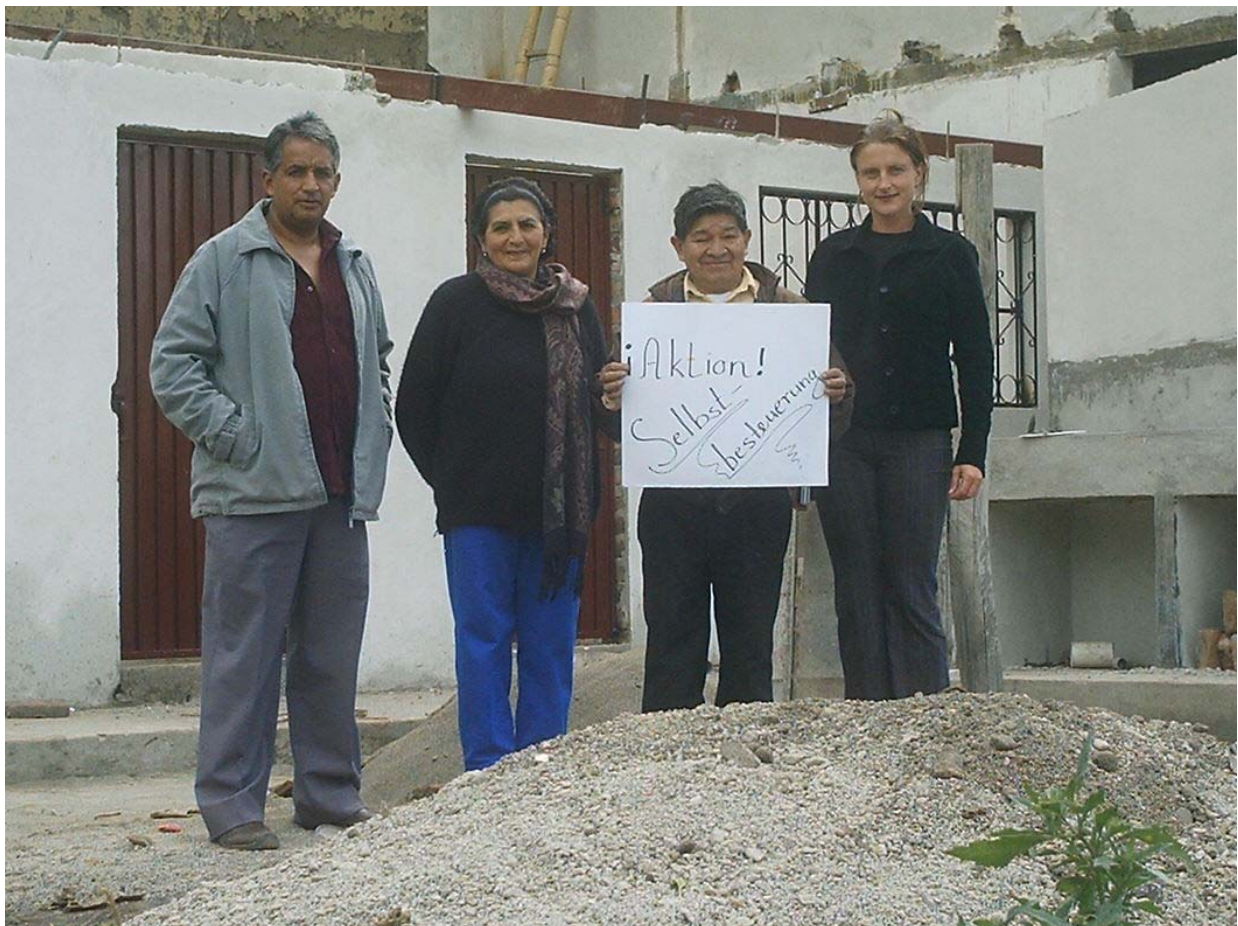
Aufgenommen in Ecuador. (Siehe Bericht auf Seite 22)

GLS Bank Frankfurt/M BLZ: 430 609 67 Nr. 8004965500 Postbank Stuttgart BLZ: 600 100 70 Nr. 339 79 - 700 Spark. Schaumburg BLZ: 255 514 80 Nr. 320 222 292