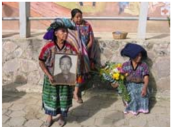
Foto: Werbung für den PBI-Film „En busca la dignidad – auf der Suche nach Würde“, den die asb mitfinanziert hat.