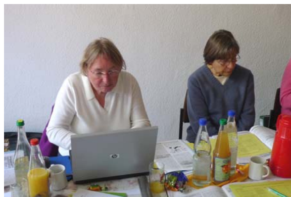
Protokoll: Astrid Standhartinger