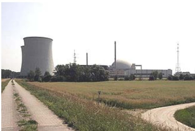
Kernkraftwerk Biblis, Block B

Der Widerstand wird auch dadurch erschwert, dass die Betroffenen relativ wenig in Sachen Kernphysik und Radioaktivität informiert sind und der niedrige Einkommensstandard sie auf eine Verbesserung ihrer wirtschaftlichen Situation durch den Uranabbau hoffen lässt.