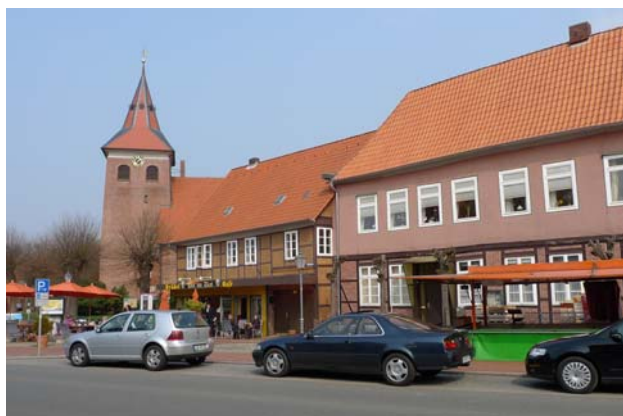
Unser Tagungsort Bleckede