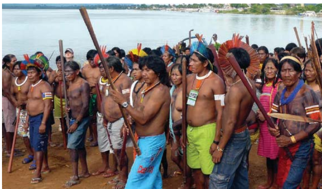
Widerstand gegen das Mammutkraftwerk Belo Monte am Rio Xingu

Die im Folgenden vorgestellte Rundreise wird zum Zeitpunkt der MV bereits abgeschlossen sein (21.3.-6.4.2010). Auf der MV dürften bereits vorläufige Abrechnung und ein Resümee vorliegen. In Absprache mit der Antragstellerin erschien die Vorstellung auf der MV sinnvoller als ein Antrag an den Feuerwehrfonds des Vorstands.